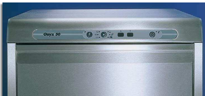
Painel electrónico Soft-touch. Tudo sob controlo e máxima limpeza