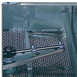
Duplo filtro inox