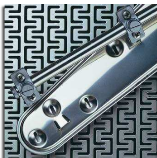
Detalhe dos braços inferiores