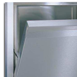
Porta balanceada com fecho "ultra soft action"