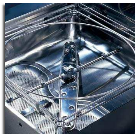
Magnífica! Nenhum tubo, nenhuma aresta, nenhuma junta de soldadura, só polidez