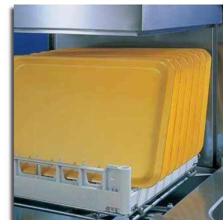
Enorme! Cerca de 42 cm de espaço útil para lavar qualquer objecto