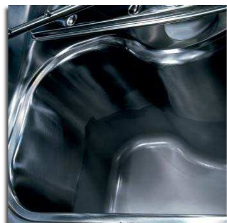
Impecável! Não permite qualquer acumulação de sujidade