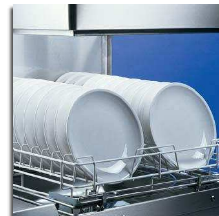
Espectacular! Com o cesto Jumbo (opcional) lava até 1.320 pratos por hora