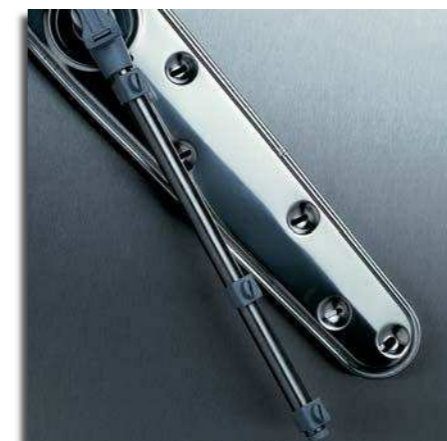
Eficaz! Braços independentes e bocais de elevada prestação