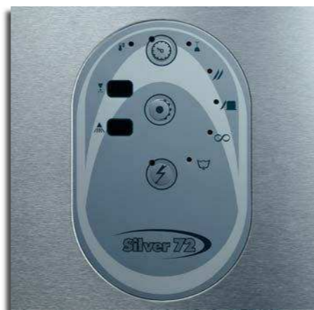
Simples! Botões de grandes dimensões e encerramento automático no momento em que a campânula é fechada

permite efectuar rapidamente a limpeza durante o período de trabalho. Fim aos maus odores! A bomba de lavagem possui escoamento próprio evitando assim estagnação da água, terreno fértil para desenvolvimento de germes e bactérias. Em muitos casos, existe uma elevada rotação de pessoal e, por esse motivo, o funcionamento da máquina é intuitivo, com funções que exigem poucos comandos, visor digital para controlo da temperatura e encerramento automático do ciclo no momento em que a campânula é fechada.