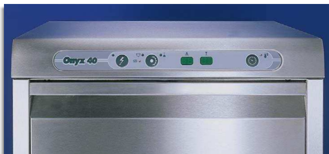
Painel electrónico Soft-touch. Tudo sob controlo e máxima limpeza