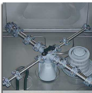
Braços de lavagem e enxaguamento em aço inox