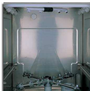
Lavagem superior para uma limpeza optimizada