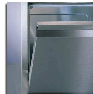
Porta balanceada com fecho "ultra soft action"