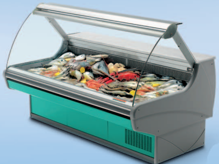
MONDEGO VCA FISH