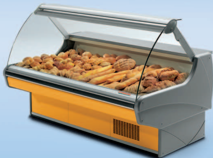
MONDEGO VCA PANE