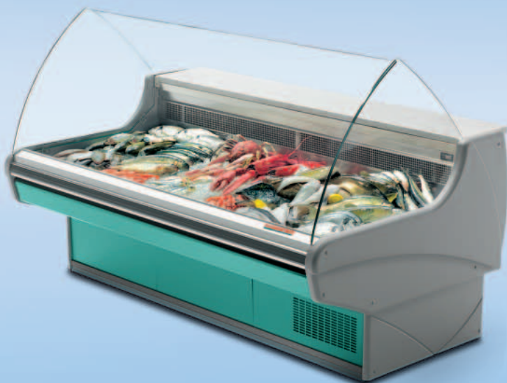
MONDEGO VCB FISH